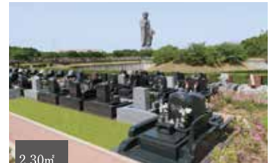
眺望の良い開放感抜群の区画 2.30㎡