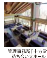
管理事務所「十方堂」 待ち合い大ホール