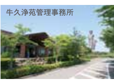
牛久浄苑管理事務所

※アンケートへのご記入を行って頂いた方に限ります。 ※1家族4枚までとさせていただきます。 ※墓所のご見学は、約1時間ほどかかります。 ※過去にご利用いただいた方は、ご利用いただけません。