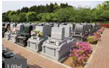
静かで落ち着いた区画 1.00㎡