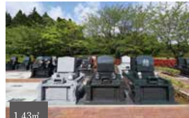
豊富なバリエーションが魅力な区画 1.43㎡