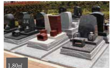
個性的なデザインと機能性を両立する人気区画 1.80㎡