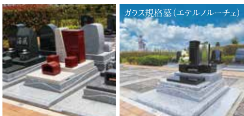
ガラス規格墓(エテルノルーチェ)