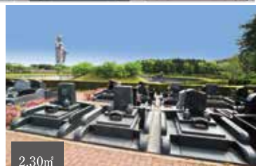
眺望の良い開放感抜群の区画