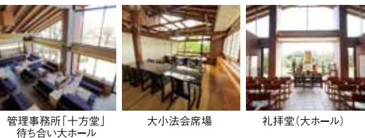
管理事務所「十方堂」 待ち合い大ホール

「十方堂」は法要や休息にご利用いただける施設。宗教を問わずご法要が行なえる礼拝堂、大仏様の全景が望めるロビーや法会席場がございます。花や線香などの用意がございますので、どうぞお体ひとつでお越しください。