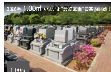
静かで落ち着いた区画

[新・ゆとり墓所とは]隣り合うお墓との間に20cmの空間を設けました。この空間がゆとりを演出します。また、お墓のお手入れがしやすい設計となっております。