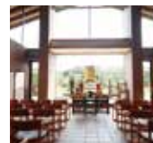
管理事務所「十方堂」 待ち合い大ホール